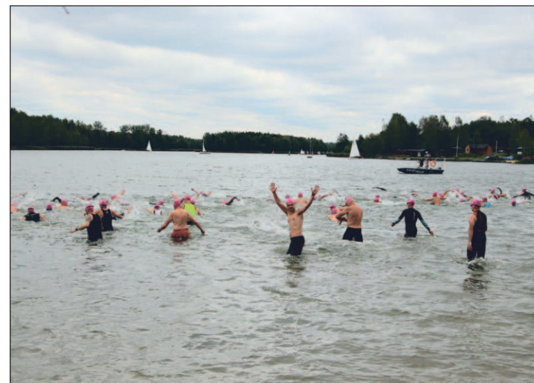
Na Sosinie co roku odbywają się rozmaite imprezy sportowe, w tym np. Triathlon "Stalowy Sokół"

To jednak nie koniec atrakcji. Nad zalewem pojawi się park wodny z dmuchanym zamkiem, zjeżdżalniami, rowerkami wodnymi i basenem