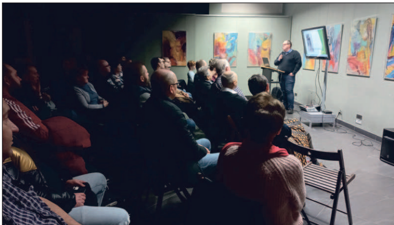
Jaworznianie chętnie biorą udział w spotkaniach z cyklu „Z historią na ty”