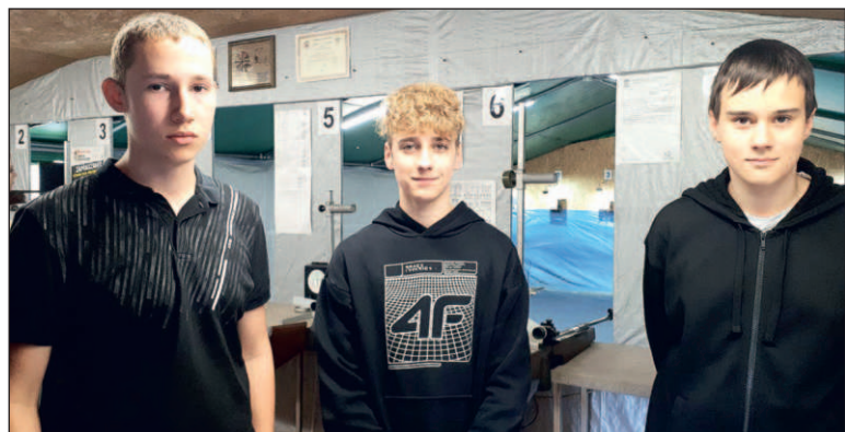
Uczniowie brali udział m.in. w konkurencjach strzeleckich