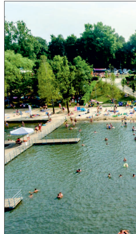
Sosina przyciąga w sezonie letnim tłumy t

Podobnie jak rok temu bezpieczeństwa plażowiczów będą pilnować ratownicy z chrzanowskiego WOPR, przez 7 dni w tygodniu w godz. 10-18. Osoby, chcące spędzić czas nad