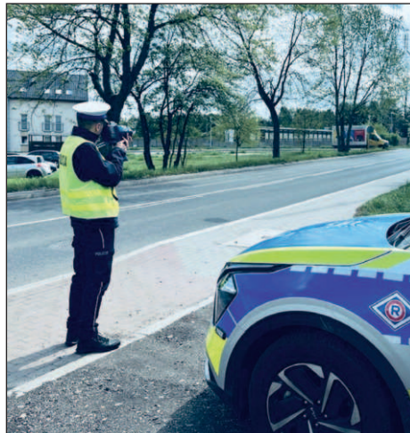
Stróżowie prawa prowadzą regularne kontrole prędkości na drogach