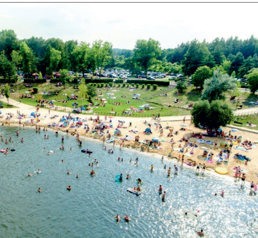
uryistów | fot. Andrzej Pokuta