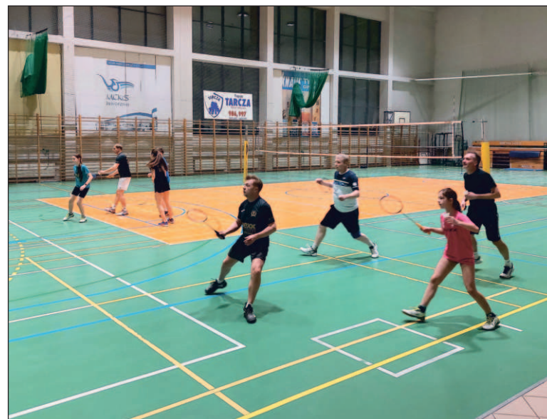
Dofinansowanie na realizację projektów profilaktycznych otrzyma m.in. klub sportowy WOLANT

Klub otrzyma na te cele dofinansowanie w wysokości 12 tys. zł. Wśród beneficjentów konkursu znalazły się także Fundacje Ko-