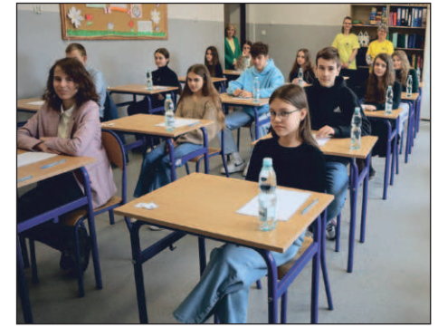
W dyktandzie wzięło udział 19 uczniów

Aby móc skorzystać z hospicyjnego wsparcia, należy wziąć od swojego lekarza skierowanie do poradni medycyny paliatywnej, która funkcjonuje w hospicjum. W POP specjaliści skonsultują dany przypadek, zdecydują, jak można pomóc pacjentowi i wskażą sposoby radzenia sobie z nasilającymi się objawami. Jeśli zachodzi taka konieczność, chorzy otrzymają też pomoc medyczną i psychologiczną.