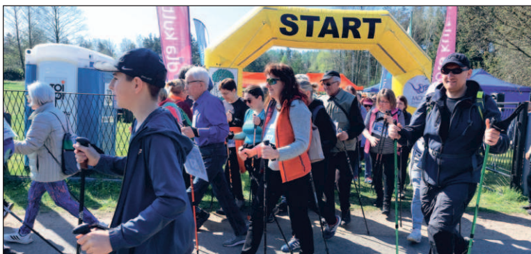
Rajd Nordic Walking w Ciężkowicach cieszy się sporą popularnością wśród jaworzniaków

Uczestnicy rajdu będą mieli do wyboru dwie trasy – pętle o długości około 8 lub 9 kilometrów. Prowadzić będą one leśnymi ścieżkami przez malowniczą dolinę Żabnika w Ciężkowicach. Start Rajdu zaplanowany jest na godzinę 10. Biuro zawodów,