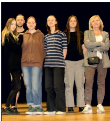
Teatr Oddzielny czeka na ludzi z pasją

W grupie mile widziani są aktorzy i wokaliści. Dla amatorów to prawdziwa szansa. W Teatrze Oddzielnym można się nauczyć nie tylko aktorstwa i popracować nad wokalem, ale także zgłębić wiedzę na temat sceno-