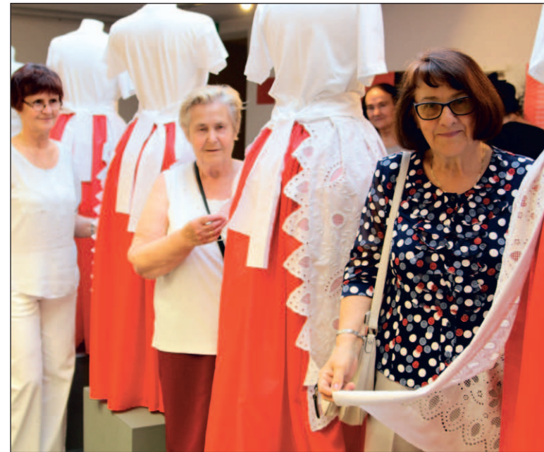
W muzeum wiele się dzieje, działa m.in. Pracownia Haftu Regionalnego

Pracownicy placówki postawili też na wystawy w przestrzeni publicznej. Przed siedzibą MMJ odbywają się więc czasowe ekspozycje, przygotowane na specjalnych planszach. Dzięki temu historia Jaworzna dociera z powodzeniem do dużo szerszej grupy odbiorców. Muzealny dorobek historycy prezentują też z powodzeniem w internecie. Zapraszamy m.in. na wirtualny spacer po jaworzniackim muzeum. Z programu „Kultura w sieci” MMJ zyskało na stworzenie takiej ścieżki edukacyjnej 35 tys. zł. Internauci, nie wychodząc z domów, mogą obejrzeć za darmo cztery wystawy stałe. Powstały też nagrania, w których muzealnicy oprowadzają swoich gości po muzeum. Internauci zyskali też dostęp m.in. do 100 infografik, nagrań lekcji mu-