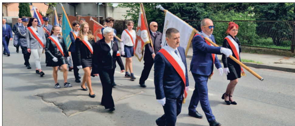
Uczestnicy obchodów przeszli do kościoła św. Elżbiety Węgierskiej, gdzie odprawiono mszę w intencji powieszonych kolejarzy