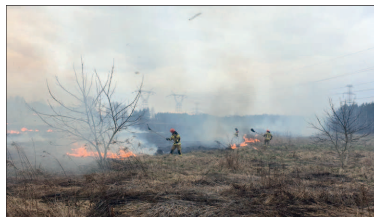
Strażacy interweniowali w ubiegłym roku m.in. przy pożarze traw w rejonie ul. Szewskiej