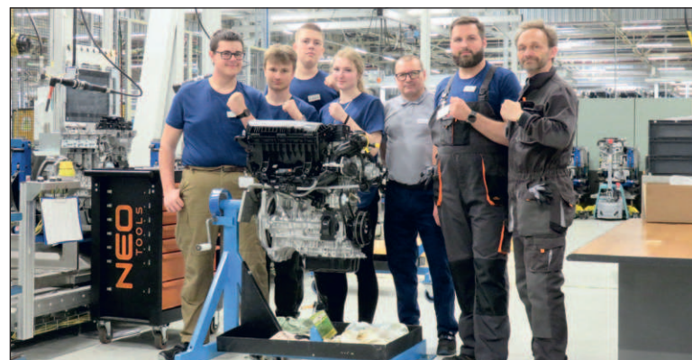
Drużyna z jaworznińskiego CKZ w hali produkcyjnej Zakładu Silników w Tychach