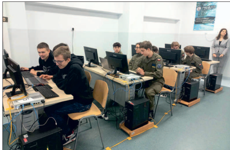
W III LO odbędzie się nabór do jednej z dwóch klas, w tym do klasy cyber.mil

Kandydat do klasy dwujęzycznej powinien znać podstawy języka an-