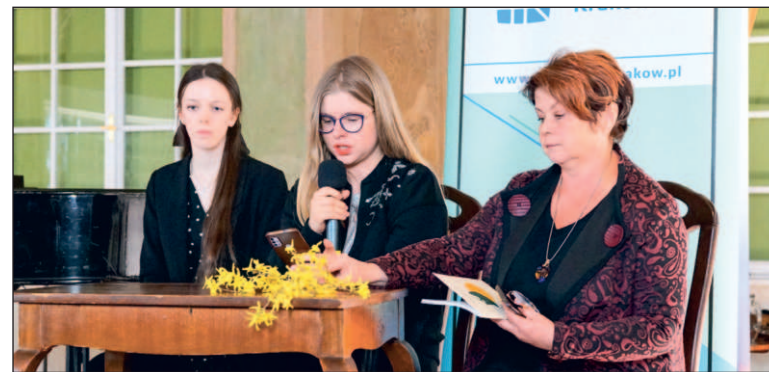
Członkowie grupy Pomiędzy Słowami chętnie dzielą się literackimi inspiracjami również poza Jaworzniem. Gościli m.in. w Krakowie