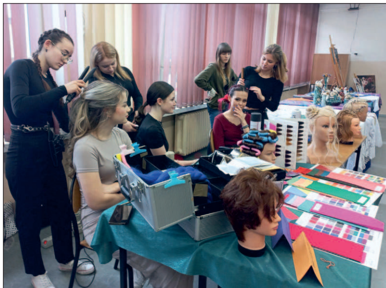
W ZSP3 wśród oferowanych zawodów jest technik usług fryzjerskich