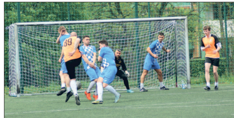
Piłkarze z PSS Salos grają co niedzielę

Jak podkreśla, najpierw pojedynkowały się zespoły drugoligowe. – Na początek Madboysi rozgromili Hammer 11:1 i z kompletem punktów kwiecień kończą na pozycji wicelidera. Następnie Fortuna Podłęże uległa Maszoperii 2:6. Eko Świrom w meczu z liderem (OPJ