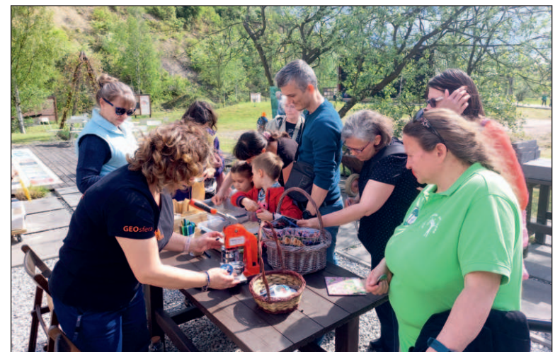
Przy stanowiskach edukacyjnych można było sporo dowiedzieć się o otaczającej nas przyrodzie | fot. Natalia Czeleń