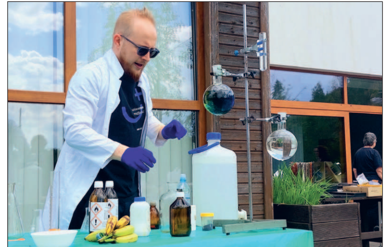
Podczas pikniku zainteresowaniem cieszyły się pokazy eksperymentów