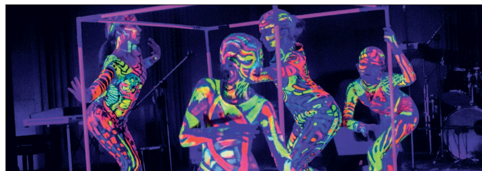
Tancerki z Dyemotion swoim występem poruszyły jurorów i widzów

Projekt będzie finansowany przez Gminną Komisję Rozwiązywania Problemów Alkoholowych w ramach kampanii „Jaworzno wolne od uzależnień”. NC