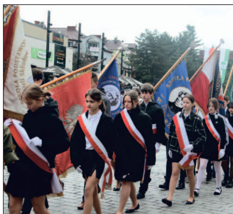
Pocztys sztandarowe znów przemarszerują przez jaworznicki Rynek

– Zapraszamy też mieszkańców, by wzięli z nami udział w uroczystym rozpoczęciu konkursu, który odbędzie się na jaworznickim Ryнку. Tam, przed pomnikiem Niepodległości, zbiorą się o godz. 10