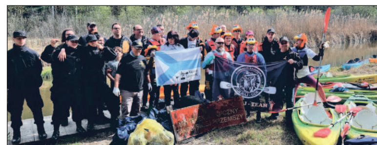
W ramach ubiegłorocznej akcji posprzątano rzekę oraz przystań w Długoszynie