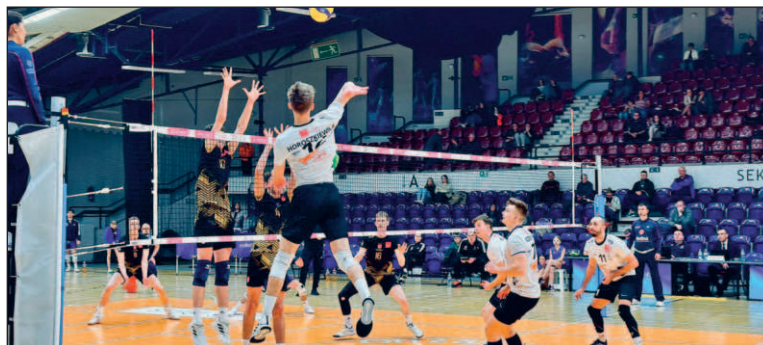
Ostatni mecz sezonu Sokół zagrały z drużyną SMS PZPS Spała