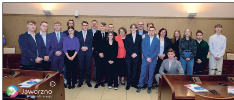
Młodzieżowa Rada Miasta w nowym składzie | fot. Materiały UM Jaworzno

istotna dla nas kwestia. Chcemy też te inicjatywy rozwijać i ulepszać. Bardzo zależy nam również na współpracy z władzami miasta. Jesteśmy chętni do działania, otwarci na nowe propozycje i pomysły, ale przede wszystkim zależy nam na rozwoju Jaworzna i dobru jego mieszkańców – podkreśla przewodniczący MRM w Jaworznie. NC