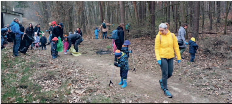
Przedшколяki z Przedszkola Montessori Ziarenko mają za sobą pierwszą akcję sprzątnięcia lasu