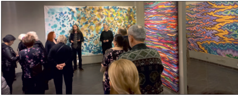
Galeria Sektor I organizuje kilka wystaw w ciągu roku. W ubiegłym jaworzniaku podziwiali m.in. prace Filipa Moszanta