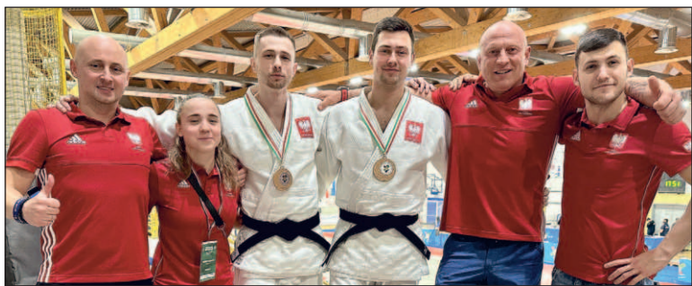
Zawodnicy Satori podczas Pucharu Europy Judo Kata