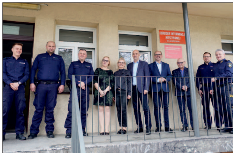
W Szczakowej otwarto nowy punkt przyjęć dzielnicowego Komendy Miejskiej Policji w Jaworznie