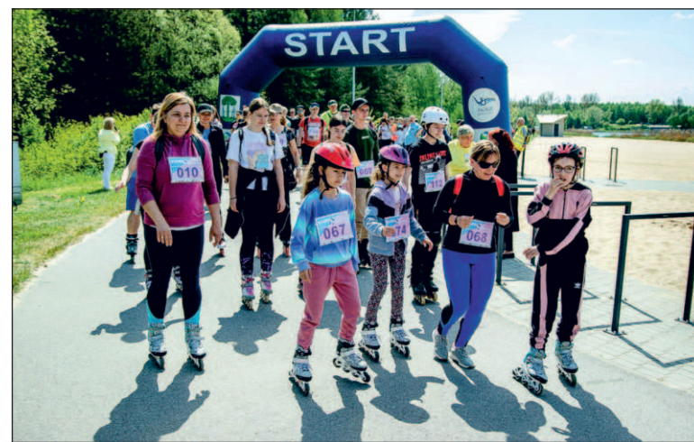
„Rolkuj po nadziei” to impreza sportowa i charytatywna

Impreza „Rolkuj po nadziei” jest połączona ze zbiórką charytatywną dla jaworznickiego hospicjum. Pro-