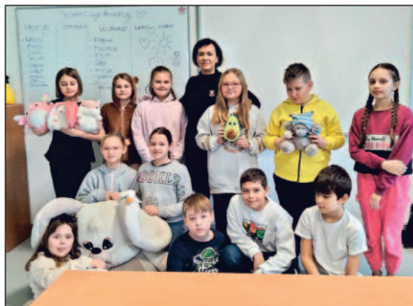
Pierwsza edycja projektu była realizowana w placówkach oświatowych w listopadzie

Pierwsza edycja programu realizowana była w listopadzie. – Projekt Jestem – Czuję – Akceptuję cieszył się ogromnym zainteresowaniem. Podstawową metodą pracy była arteterapia, bo dzięki niej możemy rozmawiać i wspierać dzieci,