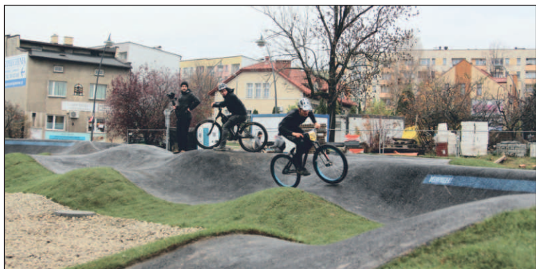
Jedną z decyzji mieszkańców Jaworzna w ramach JBO była budowa pumptracku w Centrum