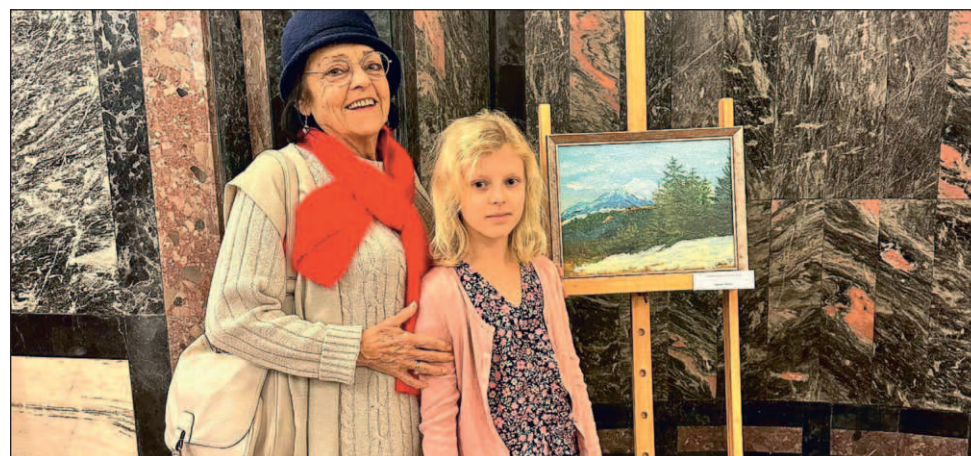
Wnuczka poszła w artystyczne ślady babci