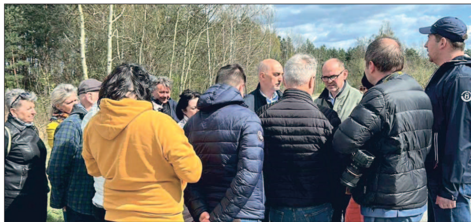
Środowe spotkanie Pawła Silberta, prezydenta Jaworzna z mieszkańcami

Koncem ubiegłego roku mieszkańcy ulicy Wolności wystosowali pismo do Prezydenta Miasta Jaworzna w tej sprawie. W styczniu 2024 r. w korespondencji pisemnej, Prezydent Silbert poinformował mieszkańców ul. Wolności, o tym, że wypracowane rozwiązania zostaną skonsultowane, a wybrane propozycje trafią do „analizy wariantowej przebiegu drogi”. – Od lat poszukujemy rozwiązania drogowego, które